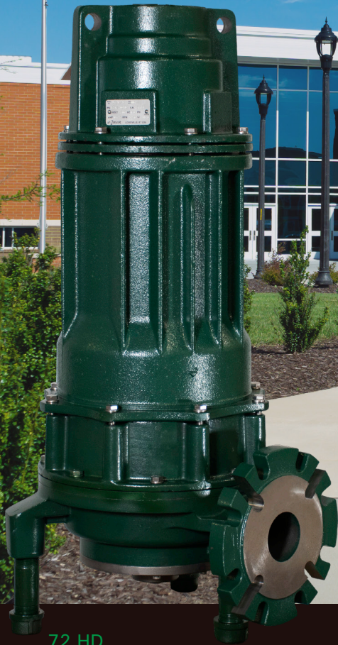
72 HD, Descarga de 4 in