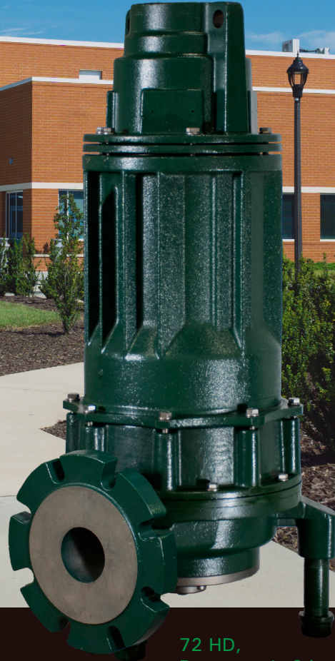
72 HD, Descarga de 3 in